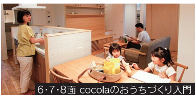
6・7・8面 cocolaのおうちづくり入門